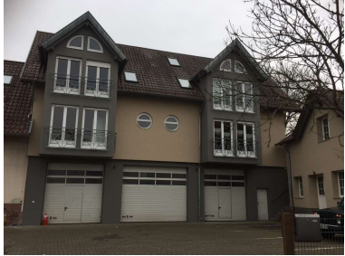
Haus mit drei WG-Zimmern in Pfinztal-Söllingen mit Wohnküche